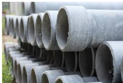
Tubazioni in cemento amianto