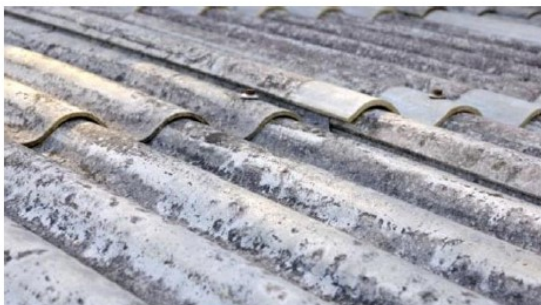
Copertura "onduline" in cemento amianto