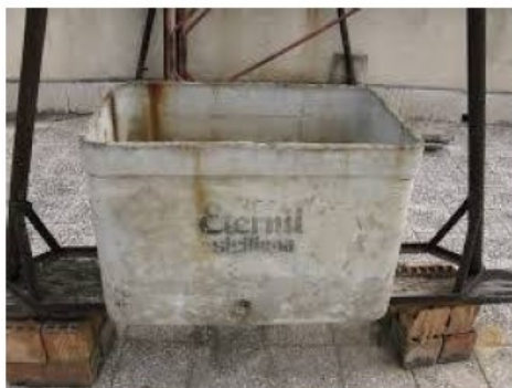
Cassoni per acqua / vasi di espansione centrali termiche in cemento amianto

Si riportano di seguito alcune immagini rappresentative ma non esaustive di manufatti contenenti amianto: